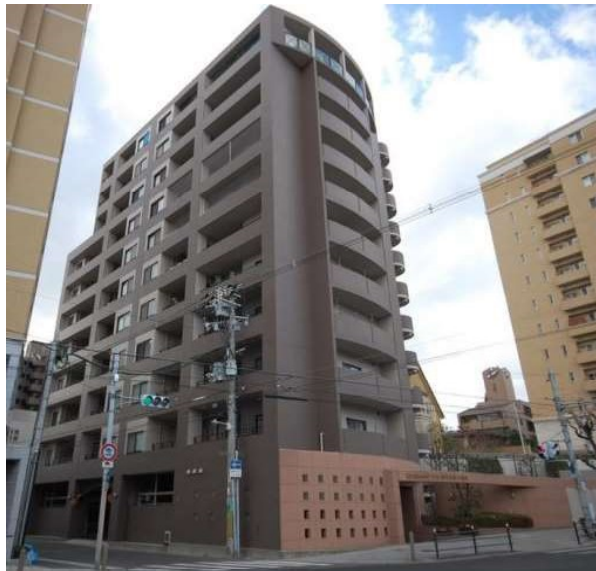
※図面と現況が異なる場合は現況優先となります。※賃料および礼金等の消減金は全て税別表記となります。